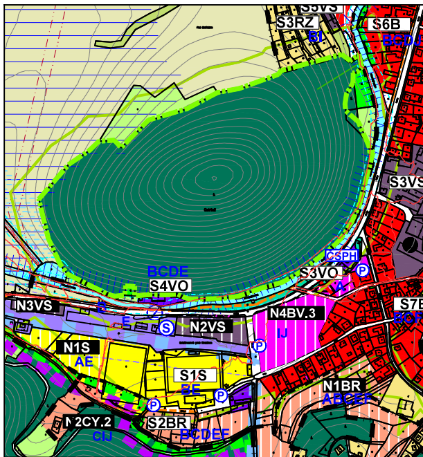
VÝREZ PO ZAPRACOVANÍ ZMIEN A DOPLNKOV č.3